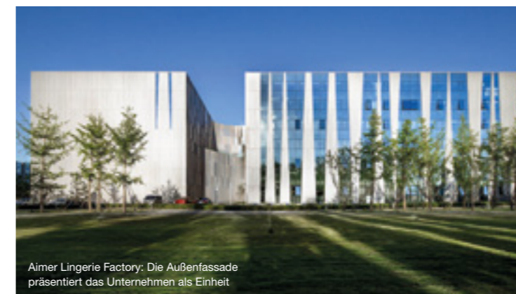
Aimer Lingerie Factory: Die Außenfassade präsentiert das Unternehmen als Einheit

The layout shows an organic void meandering through the structure, creating the inner landscape. A doubled public space on both ground floor and the deck benefits from the