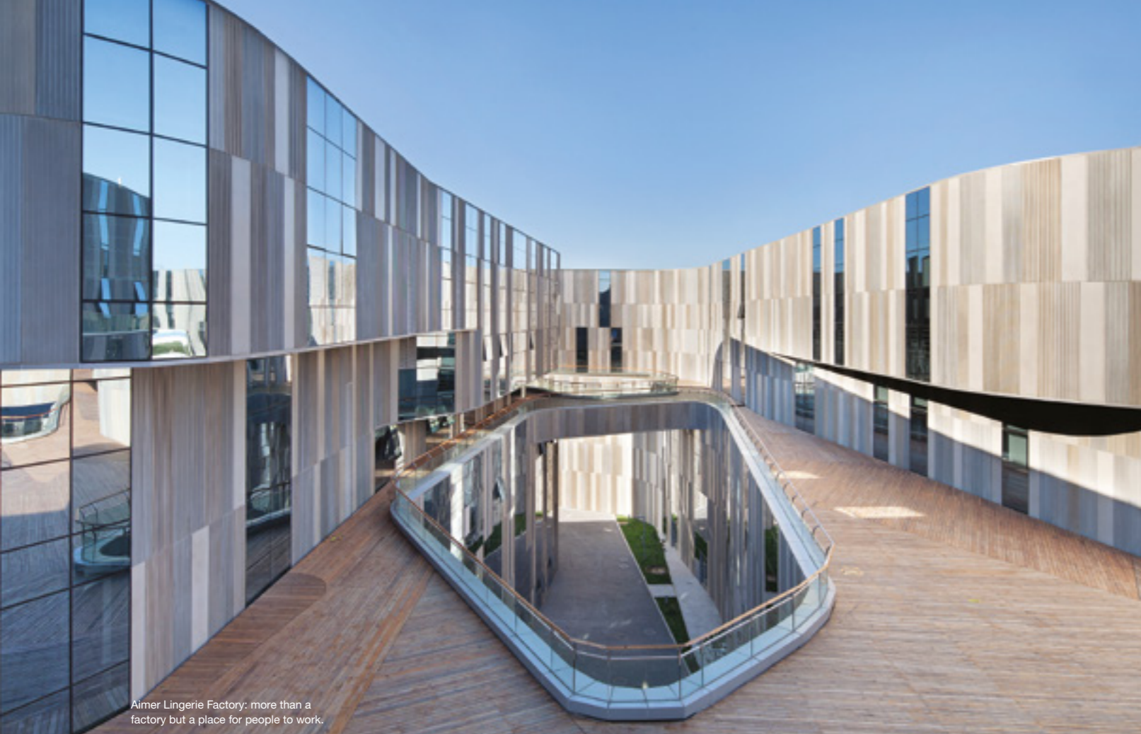
Aimer Lingerie Factory: more than a factory but a place for people to work.

Der Grundriss zeigt einen organisch geschwungenen Einschnitt, der sich durch den gesamten Komplex zieht und eine Art innerer Gebäude-Landschaft kreiert. Ein gedoppel-