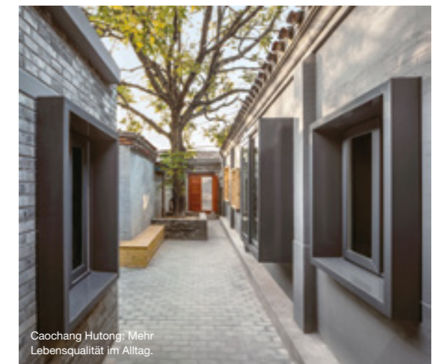
Caochang Hutong: Mehr Lebensqualität im Alltag.